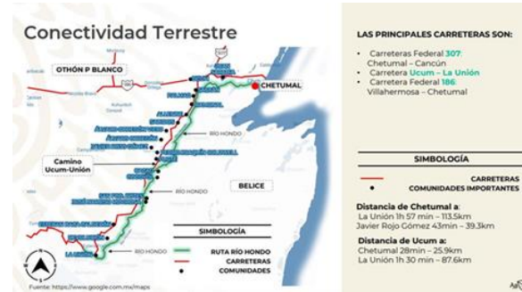
Figura 1. Conectividad Terrestre

La figura 1 muestra la conectividad terrestre de la Ribera del río Hondo, que se encuentra localizada en el municipio de Othón P. Blanco, tomando la carretera 186 Chetumal-Villahermosa aproximadamente a 25 kms de la intersección de Escárcega / Campeche en la desviación hacia el Sur de la comunidad de Ucum.