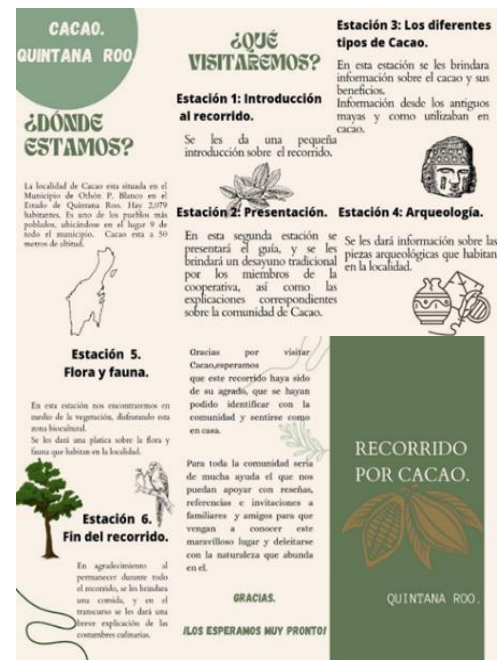
Figura 4. Tríptico del sendero interpretativo que se entrega al turista.

Además de la delimitación del Sendero Interpretativo y el Guión correspondiente, se elaboraron materiales como folletos, trípticos (figura 4), creación o actualización de redes sociales, así como la elaboración de la guía para el taller de capacitación a los guías del sendero interpretativo.