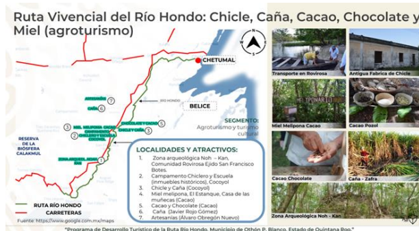
Figura 2. Ruta Vivencial del Río Hondo, Municipio de Othón P. Blanco, estado de Quintana Roo.

Fase II. Diseño del sendero. El sendero respalda aún más su fundamento en los planteamientos del Programa de Desarrollo Turístico de la Ruta Río Hondo, Municipio de Othón P. Blanco, estado de Quintana Roo, tal como se puede observar en la figura 2, de la Ruta Vivencial del Río Hondo.